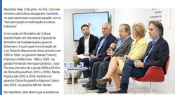
Ex-ministros reuniram-se para denunciar o retrocesso do Governo Bolsonaro. No dia 1º de julho, dez ex-ministros da Ciência, Tecnologia e Inovação divulgaram um manifesto para denunciar o colapso no setor. No dia 02, os ex-ministros da Cultura reivindicaram a recriação da pasta e o fim da perseguição contra os artistas.