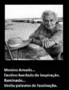
Menino Amado... Destino bordado de inspiração. Bemineado... Vestiu palavras de fascinação.

Acaba de ser inaugurada no Museu da Língua Portuguesa a exposição "Jorge Amado e Universal: Um olhar inusitado sobre o homem e a obra". Com módulos dedicados aos personagens, à vida política e pessoal do escritor baiano, a exposição integra o calendário das comemorações oficiais do centenário de Jorge Amado. O Museu da Língua Portuguesa fica na Praça da Luz; os ingressos custam R$ 6,00 e, aos sábados, a entrada é franca.