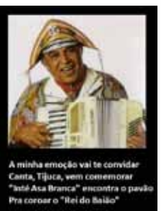
A minha emoção vai te convidar Canta, Tijuca, sem comemorar "Batê Aca Branca" encontra o pavão Pra coroar o "Rei do Baião"

Acaba de ser inaugurada no Museu da Língua Portuguesa a exposição "Jorge Amado e Universal: Um olhar inusitado sobre o homem e a obra". Com módulos dedicados aos personagens, à vida política e pessoal do escritor baiano, a exposição integra o calendário das comemorações oficiais do centenário de Jorge Amado. O Museu da Língua Portuguesa fica na Praça da Luz; os ingressos custam R$ 6,00 e, aos sábados, a entrada é franca.