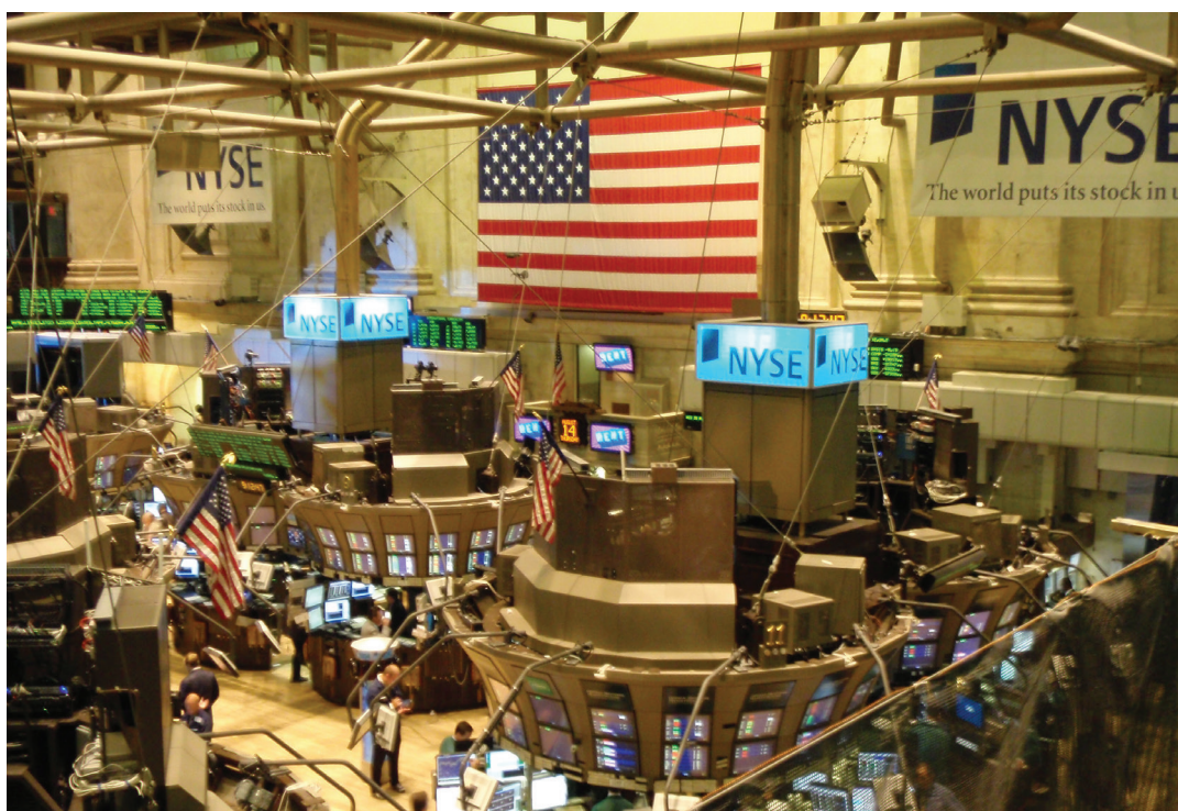
A água de São Paulo é trocada por dólares em Nova York

O grande problema de falta de água vem do fato de não haver investimento para a proteção de mananciais e construção de infraestruturas alternativas de captação de água.