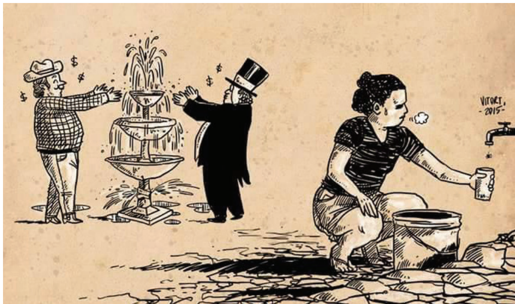
Vitor Teixeira • vitortegom.tumblr.com