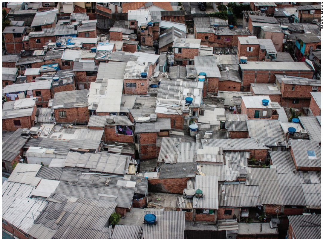
Uma desigualdade criminosa, comum de se ver em São Paulo, promovida pelo Governo Alckmin

e precisa ser frequentemente socorrida pela água do Sistema Cantareira (esse falido).