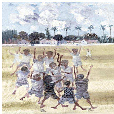
“Meninos brincando”, 1958, de Portinari.

O que é infância? É mais adequado identificá-la como infância ou infâncias? Quem é a criança atendida pelo Ciclo Interdisciplinar? Quais seus interesses, direitos e necessidades? Quais os cuidados necessários ao educar uma criança no Ciclo Interdisciplinar, pensando na indissociabilidade entre cuidar e educar: