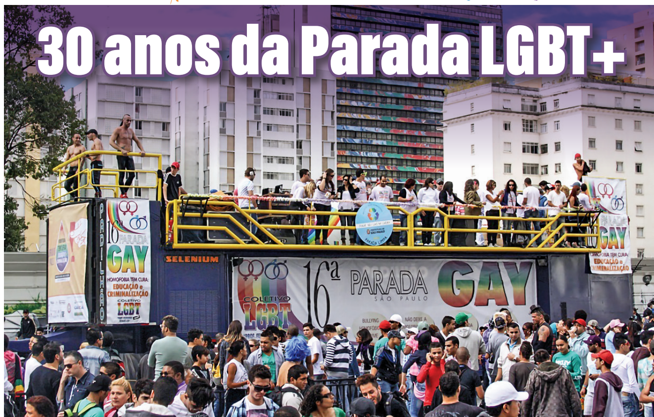
Trio elétrico da APEOESP na 16ª Parada, em 2012.

E m junho de 1969, em Nova York, um conflito entre a polícia e frequentadores do bar gay Stonewall Inn, foi o marco do movimento homossexual que deu origem a uma manifestação, no ano seguinte, que viria a ser conhecida como Parada do Orgulho Gay.