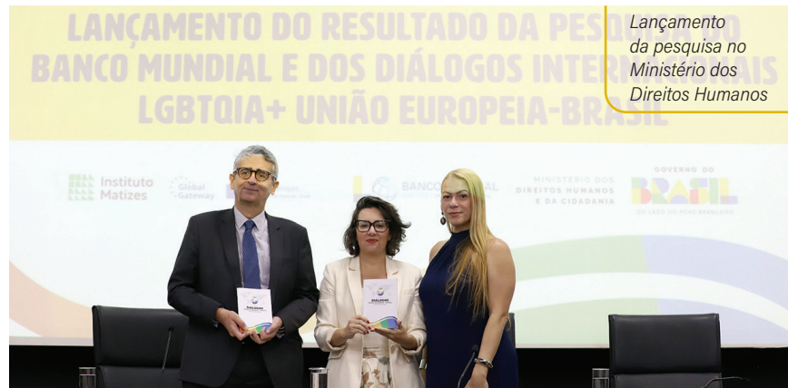
Lançamento da pesquisa no Ministério dos Direitos Humanos

A população LGBTQIA+ enfrenta restrições no acesso à educação, a serviços de saúde, a oportunidades econômicas e no mercado de trabalho. De acordo com pesquisa realizada pela