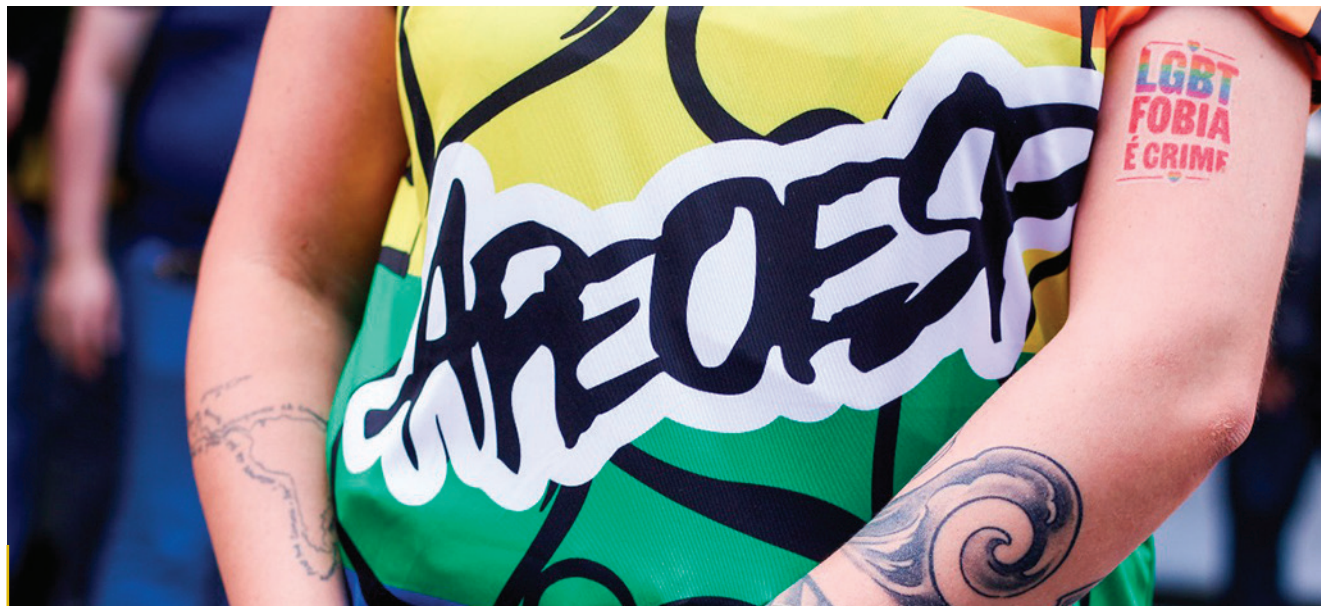
Intolerância contra a população LGBTQIA+ leva atos LGBTfóbicos e aumenta a violência.

lançado em maio deste ano, o “Atlas da Violência 2025” traz um diagnóstico abrangente da violência no País, reunindo dados sobre homicídios, crime contra populações vulneráveis, desigualdades raciais e de gênero, entre outros temas. Produzido em parceria pelo Ipea (Instituto de Pesquisas Econômica Aplicada) e pelo Fórum Brasileiro de Segurança Pública, o estudo apontou uma redução na taxa de homicídios, que chegou a 21,2 por 100 mil habitantes em 2023 – o menor índice em 11 anos – e a queda de 30% nas mortes violentas desde 2017.